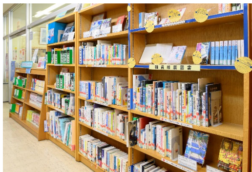
学生図書 of 充実